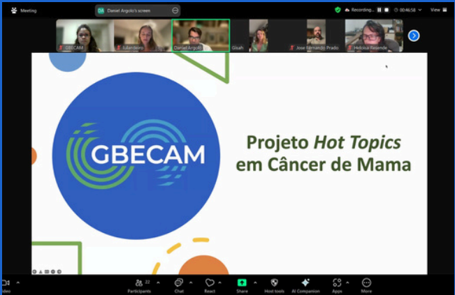
Reunião estratégica da gestão do GBECAM

Realizamos encontros estratégicos com a participação da Presidência, Diretoria, Coordenações e Comitês do GBECAM, com o objetivo de fortalecer parcerias, fomentar sinergias e ampliar a captação de recursos. Nessas reuniões, discutimos a apresentação do Book Institucional e exploramos novas oportunidades de parcerias estratégicas, buscando expandir nossas iniciativas e aumentar o engajamento. Seguimos comprometidos na consolidação dessas colaborações para potencializar nosso impacto!